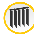
Vertikaljalousie 89, 127 mm